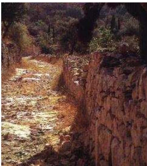
A képen az Olajfák hegyéről a Jeruzsálembe vezető út látható.